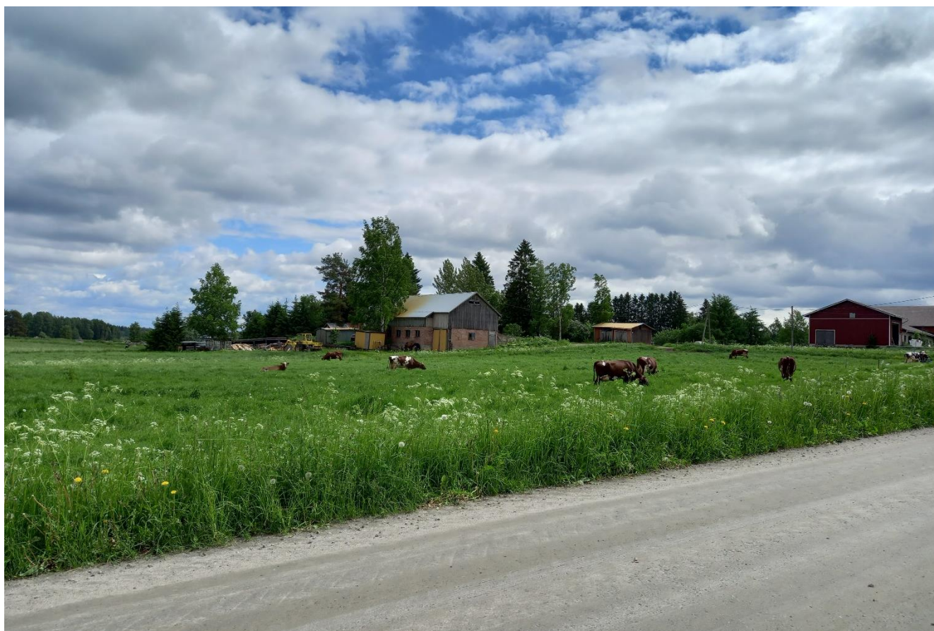
Kuva 3. Hyvättiläntien maalaismaisemaa

Kaava-alueella on voimassa Joutsenon maaseutualueiden kehittämissuunnitelma (Kaupunginvaltuusto 31.3.1980, ei oikeusvaikutteinen). Lappeenrannan pienvesistöjen ja kylien osayleiskaava, Joutsenon osa-alue tulee korvaamaan alueellaan tämän osayleiskaavan. Kaava-alueella on voimassa myös ranta-asemakaava Nuijamaanjärven rannassa Linniemellä. Ranta-asemakaava on alueellaan voimassa myös osayleiskaavan voimaantulon jälkeen.