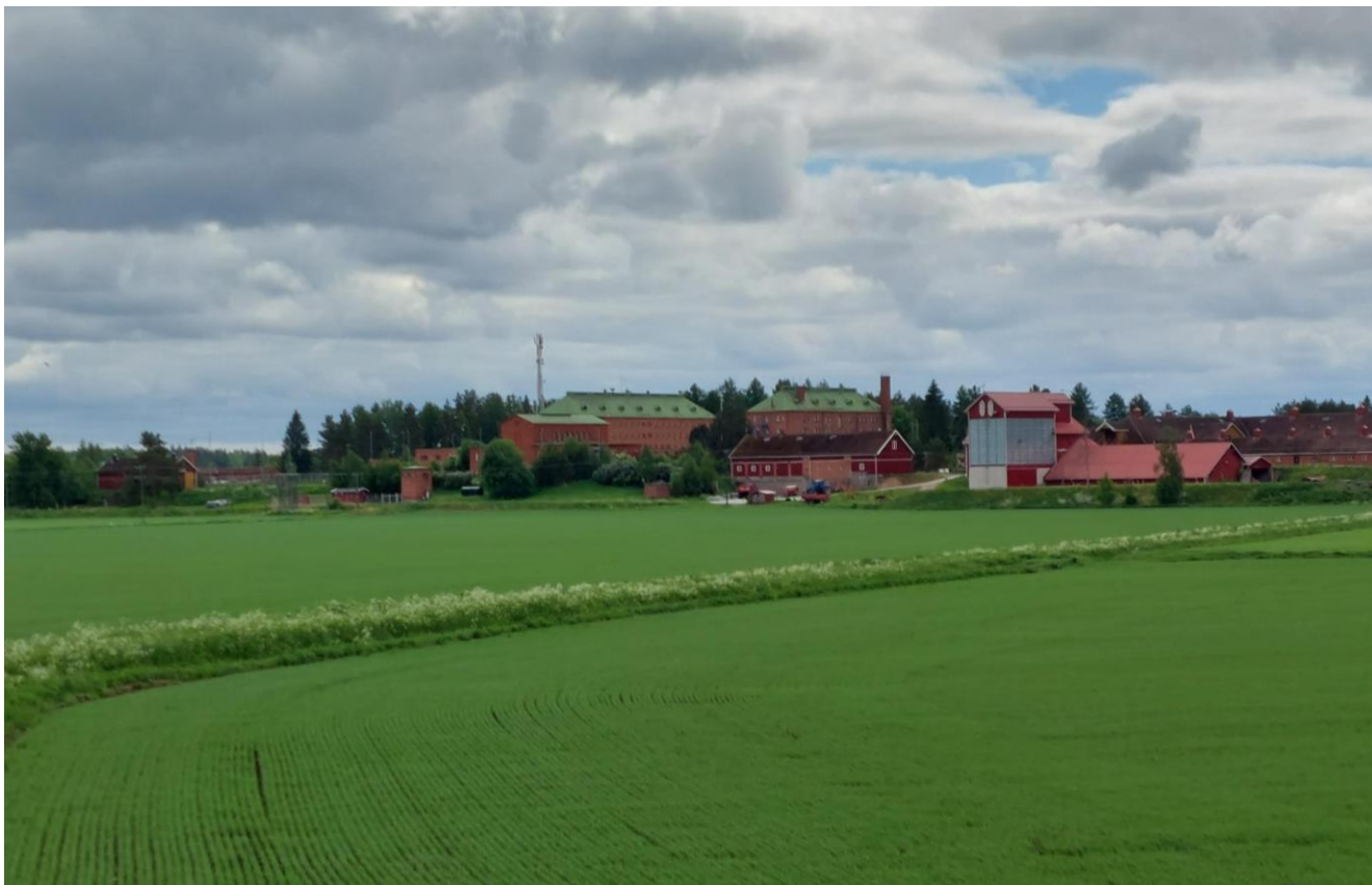
Kuva 2. Konnunsuon vankila

Maankäytön suunnittelun painopiste tulee olemaan pienvesistöjen rannoilla ja kylien alueella. Laaja kaava-alue mahdollistaa haja-asutusalueen maankäytön kokonaisrakenteen suunnittelun ja kyläalueiden tasapuolisen kehittämisen.