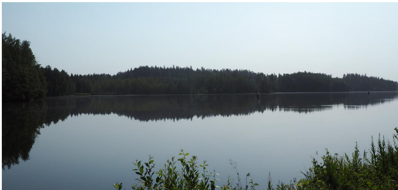
Kuva 5. Nuijamaanjärvi

Osallistumis- ja arviointisuunnitelmaa täydennetään ja tarvittaessa muutetaan suunnittelun edetessä.