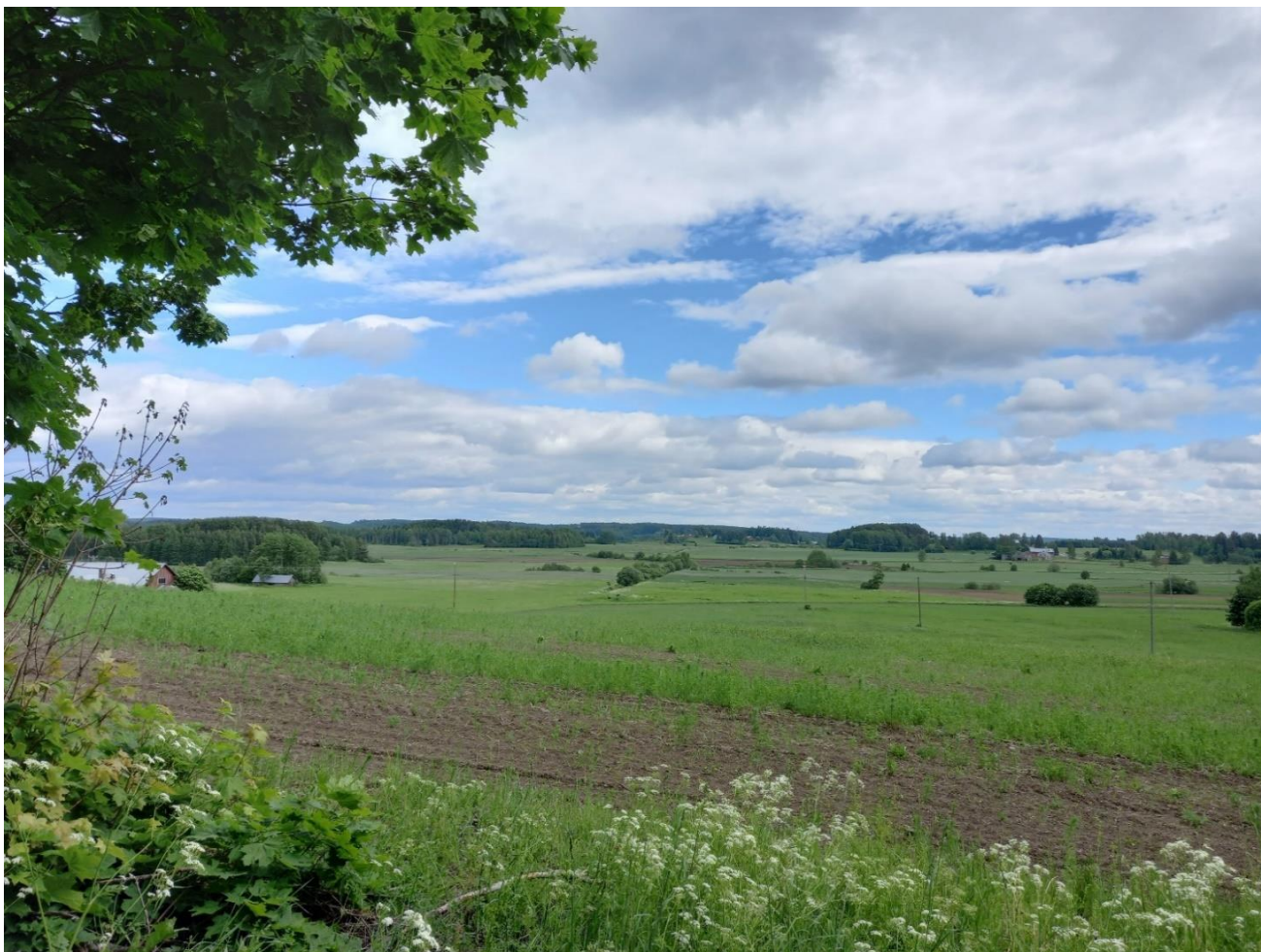
Kuva 4. Joutsenon viljelymaisemaa Ravattilasta etelään